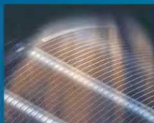
Оттаивание и продувка