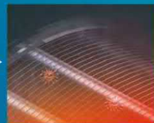
Стерилизация при +57°C в течение 30 мин